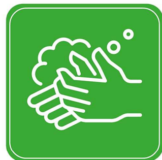
6. Finger einzeln