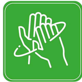
3. Rechte Handfläche über linken Handrücken und umgekehrt