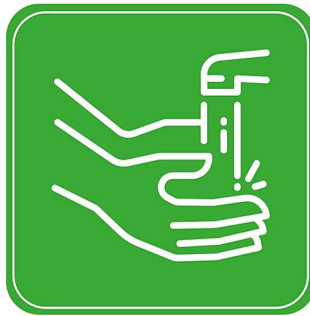
2. Hände befeuchten