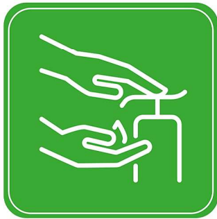
1. Portion Seife

Bitte hab Verständnis dafür, dass die strengen Auflagen eingehalten werden müssen. Danke.