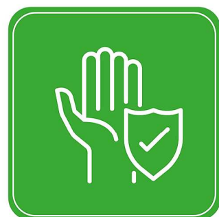
9. Saubere Hände